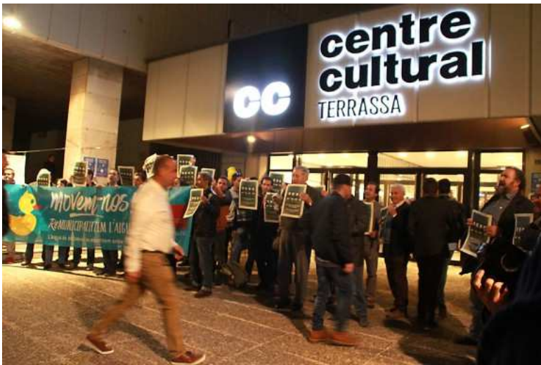
Una trentena de manifestants han protestat contra Mina.